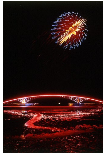
Penghu Ocean Fireworks Festival

Das Penghu Ocean Fireworks Festival existiert seit Mai 2002, nach dem Absturz eines Flugzeuges vor der Küste von Penghu. Diese Katastrophe führte dazu, dass die Zahl der Touristen auf Penghu in diesem Jahr sanken. Um den Tourismus dort zu fördern, arbeitete die Penghu County Regierung mit China Airlines zusammen, um das „Amorous Penghu“ Event am Penghu Fisherman's Wharf am chinesischen Valentinstag zu veranstalten. Highlight des Festivals waren Feuerwerke, die die Schönheit des sternenklaren Nachthimmels hervorheben. In den Folgejahren wurde das Fest aufgrund des großen Erfolgs und der riesigen medialen Berichterstattung im romantischen Guanyin-Pavillon wiederholt. So wurde die Penghu County Regierung offizieller Gastgeber des 1. jährlichen Penghu Fireworks Festival, das von Jahr zu Jahr immer mehr Einheimische und Touristen anlockt. Touristen können das Feuerwerk aus nächster Nähe genießen, da die Feuerwerkszündung nur etwa 300 Meter vom Aussichtspunkt entfernt liegt. Neben den spektakulären Feuerwerken unterhalten zahlreiche renommierte abwechselnd auf extra errichteten Bühnen.