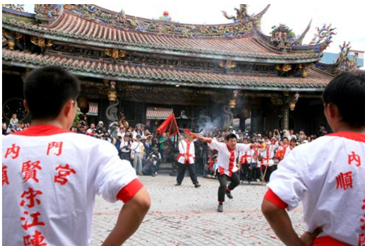
Boasheng Cultural Festival

Das Boasheng Cultural Festival findet vom 01.04. – 27.05.2017 in Dalongdong, einem der gut erhaltenen historischen Viertel Taipehs, statt. Das Viertel ist bekannt für seine zahlreichen, malerischen Wohnhäuser und religiösen Stätten rund um den Bao'an Tempel. Der Dalongdong Bao'an Tempel ist einer der Beliebtesten unter Taiwans Tempeln und einmal im Jahr Gastgeber des jährlichen Baosheng Kulturfestival, einem Symbol für Taiwans religiöse Feiern, architektonische Vermächtnisse und Bemühungen der Revitalisierung des Weltkulturerbes für Einheimische und Besucher. Von April bis